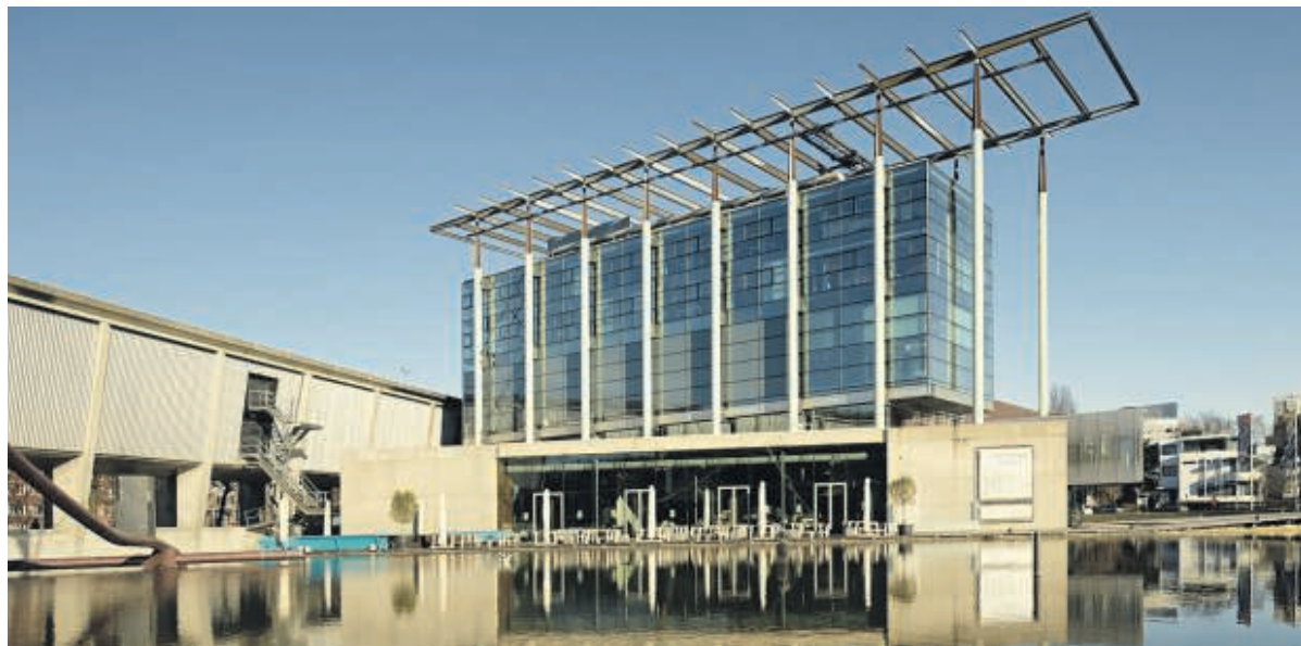
Het Nieuwe Instituut voor architectuur, design en e-cultuur in Rotterdam.