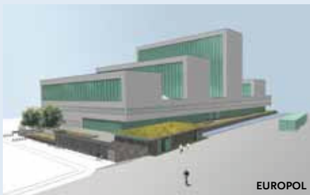
www.qwa.nl - 32.000 m 2