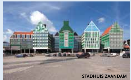
www.soetersvaneldonk.nl - 31.500 m 2

Sjoerd Soeters en Jos van Eldonk hebben een naam opgebouwd met grote en spraakmakende stedelijke herstructureringsplannen in Nederland en recent ook in Denemarken. Zo werken ze op dit moment aan een herstelplan voor het centrum van Zaanstad met een inventieve en deels opgetilde route naar en over het bestaande spoor. Naast gebouwen in Ede en Veenendaal telt vooral het nieuwgebouwde stadhuis van Zaanstad mee in het bereiken van dit grote totaaloppervlak.