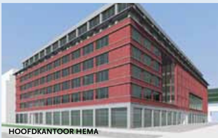
www.bronsvoortblaak.nl - 32.000 m 2

Dat een kleiner architectenbureau vanaf de Utrechtse heuvelrug kan uitgroeien tot een bureau met nationale ambities bewijst de inventieve, deskundige en tevens vasthoudende architect Anton Bronsvoort. Samen met zijn partners Henk-Geert Blaak en recent Erik van Rhenen begeleidt hij zijn inmiddels landelijk gespreide opdrachten vanuit hun centraal gelegen en gegroeide kantoor. Voor het eerst in deze lijst met een project dat in slechts enkele jaren tot stand kwam, het nieuwe kantoorgebouw voor Hema en VNU aan het IJ in Amsterdam-Noord.