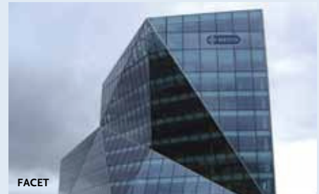
www.tibarchitecten.nl - 39.000 m 2