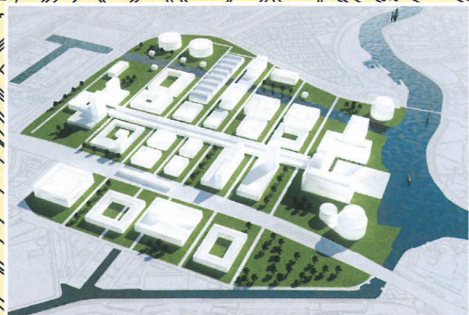
Cees Dam bepaalde het vloeroppervlak van alle overheidsgebouwen in Den Haag en zorgde ervoor dat ook in het nieuwe regeringscomplex 900.000 vierkante meter beschikbaar is. De verschillende gebouwen van het regeringscentrum worden ontworpen door toparchitecten uit binnen- en buitenland.