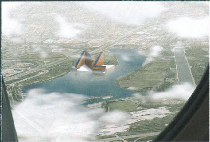
In het gebouw bevinden zich, naast het NLMuseum, ook appartementen en kantoren. Het dak bestaat uit een hellend stenen strand, dat afloopt naar het water. In de top van de N is een restaurant met uitzicht over Schiphol.